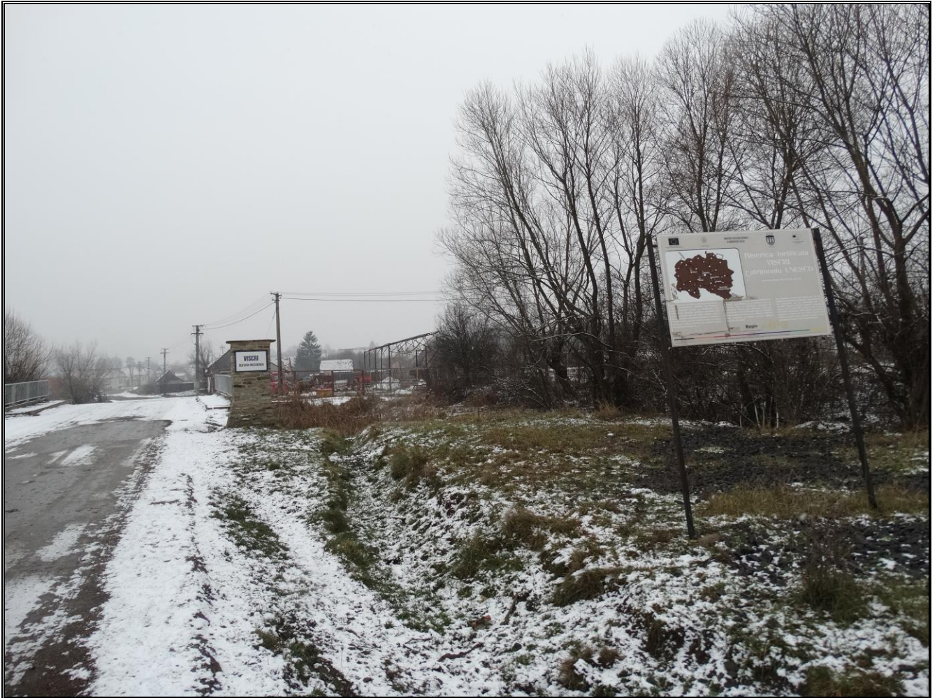
Viscri. Semnalizarea sitului nu respectă normele din Lege 564/2001. Foto decembrie 2015