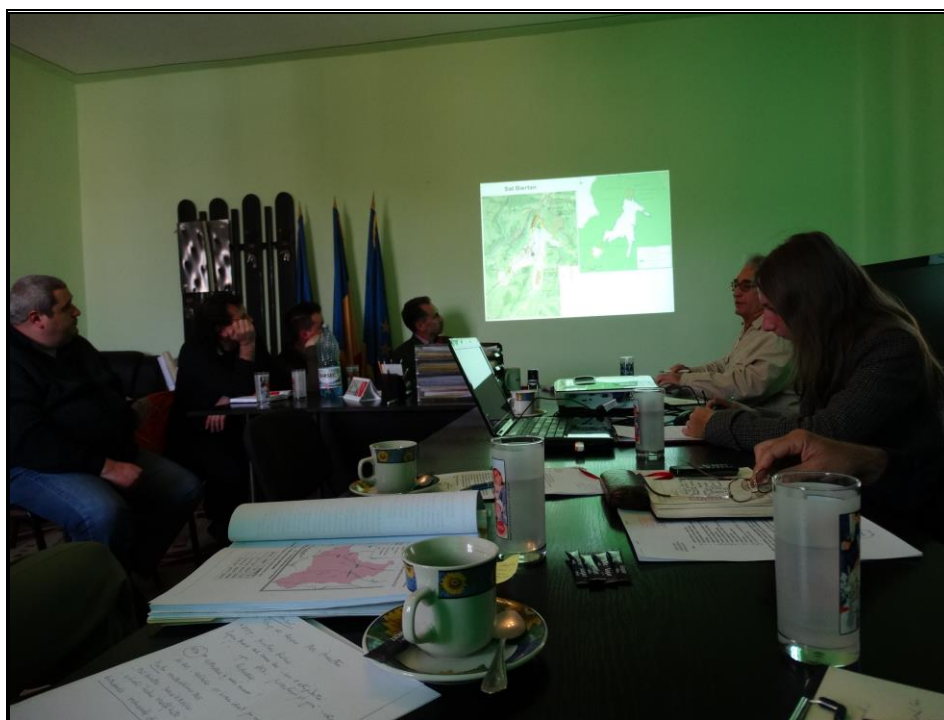
Biertan. Ședința de consultare pentru PUG, cu participarea COU. 16.04.2015