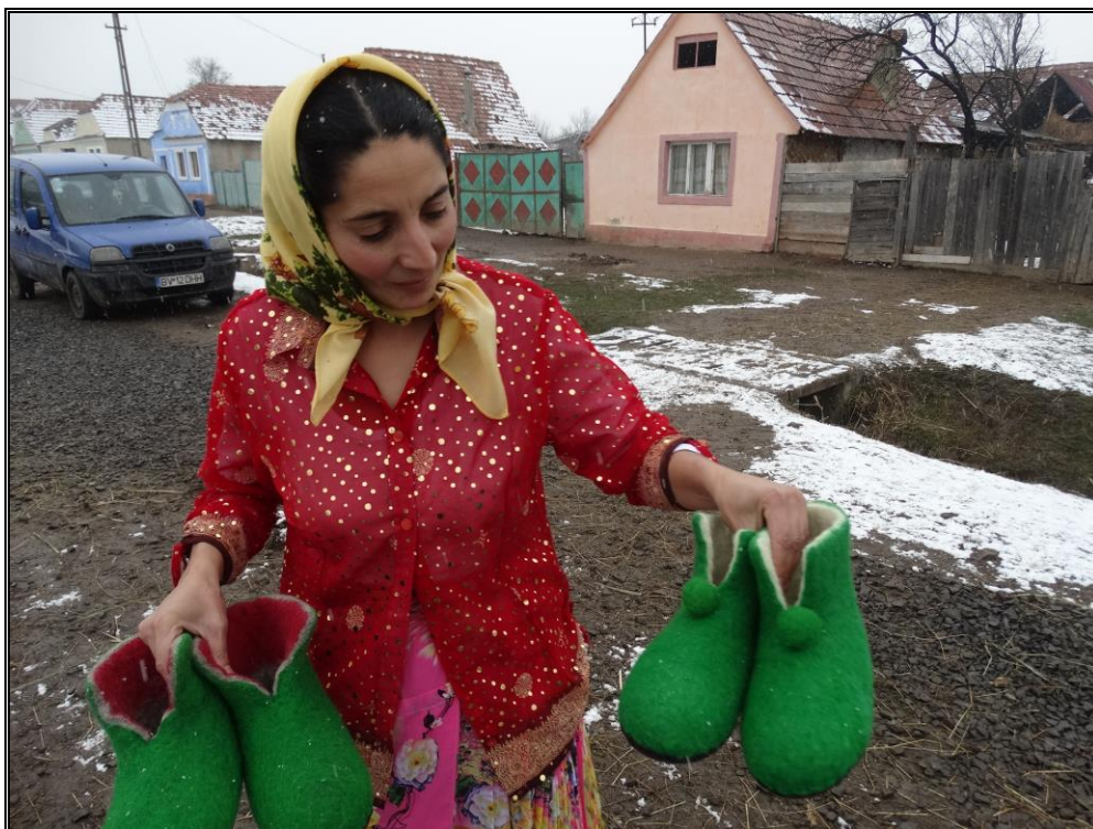
Viscri. Șoșonii de păslă confecționați în proiectul “Viscri începe”. Foto decembrie 2015

Saschiz: Fundația ADEPT a inițiat recuperarea tradiției producerii casnice de dulcețuri, gemuri și siropuri de fructe, zacuscă și miere (27 sortimente). În 2010 s-a deschis fabrica de gemuri și siropuri (Transylvania Food Company). „Dulceața de Rubarbă” este marcă înregistrată.