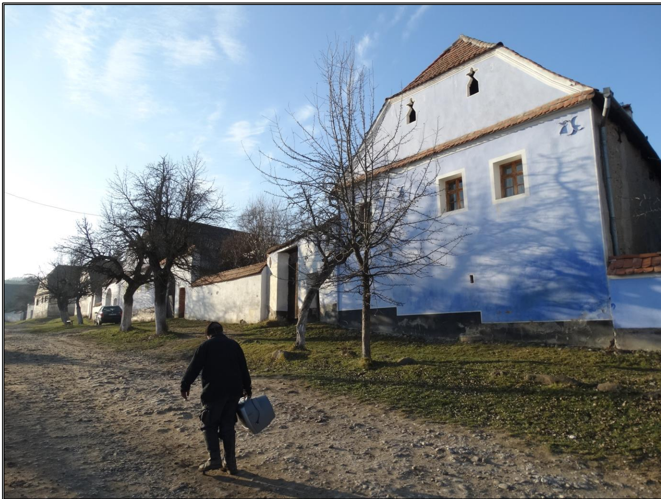
Viscri. Perspectivă asupra satului, pe Langgasse, frontul nordic. Foto decembrie 2015

Valorile siturilor, ca și semnificația acestora, așa cum au fost definite la momentul înscrierii și extensiei sale au rămas, în linii mari, neschimbate.