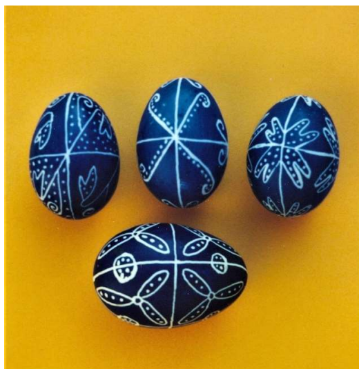
Cotnari – Iași (AFMB)

În general, ouăle încondeiate sau „scrise” folosesc semnele unui cod cultural special, pe care noi îl putem încă descifra astăzi, dacă ne raportăm la caracteristicile socio-culturale ale societății tradiționale de esență agro-pastorală, la intenția încondeietoarelor de a trimite mesaje despre flora și fauna specifice spațiului carpato-danubiano-pontic. La un nivel complex al sensului, ornamentele de pe ouăle încondeiate ne comunică speranța în destinul fericit al ființei umane și bucuria Învierii.