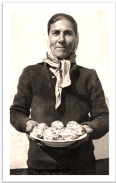
Încondeitoare din Valea Sării, Nereju – Vrancea, 1975 (Arhiva de Folclor a Moldovei și Bucovinei)

Din punct de vedere istoric, se consideră că simpla colorare a ouălor a precedat procedeul complex al desenării de ornamente pe coaja acestora. În spațiul românesc, culorile tradiționale sunt: roșul (simplu, cărămiziu, întunecat, aprins, potolit, purpură, culoarea macului, vișină putredă ș.a.), apoi galbenul , verdele , maroul , negrul , albastrul , movul ș.a. În vechime, aceste culori erau obținute în mod natural din frunze, flori, fructe, scoarță și rădăcini de arbori, care erau amestecate, pisate, macerate, fierte etc.