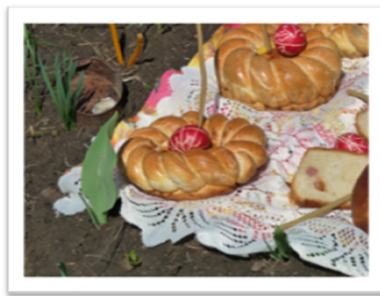
Ouă încondeiate date de pomană pe mormânt la Doina, Răuseni – Botoșani, 2012 (AFMB)