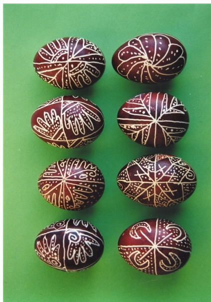
Brusturoasa – Bacău (AFMB)