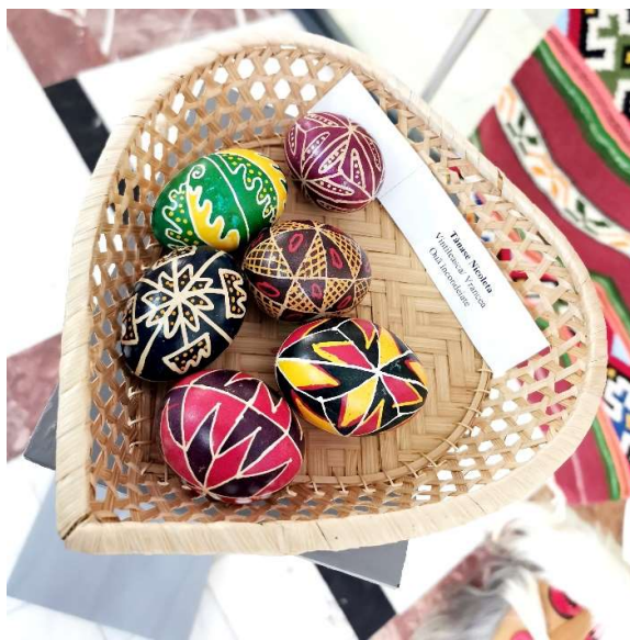
Ouă încondeiate de Nicoleta – Tănase (Vintileasca – Vrancea) (Centrul Cultural Vrancea)