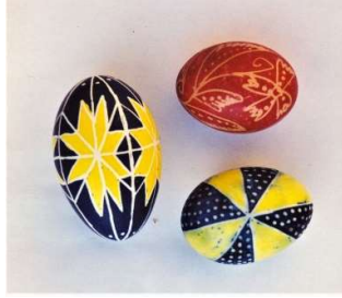
Siret – Suceava (AFMB)