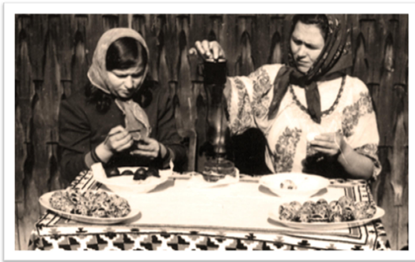
Încondeiatul ouălor în Săptămâna Mare la Ulma – Suceava, 1973

Pentru a „scrie” ouăle cu ceară, se folosește chișița (numită și închistritoare , condei , pană de găscă , tcșiță etc.), un instrument special inventat pentru realizarea diverselor ornamente. Chișița este un bețișor de 10-15 centimetri, la capătul căruia este formată o gaură de mărimea unui ac mai gros, prin care se introduce un cilindru fin de tablă, în interiorul cilindrului se pune un fir de păr de porc pentru ca ceara topită să poată fi distribuită uniform pe suprafața oului. Ceara cu care se lucrează trebuie să fie menținută în stare fluidă cu ajutorul unei surse de căldură (lampa cu petrol, bec).