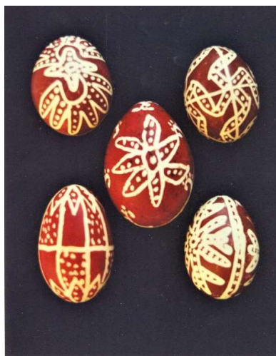
Oțeleni – Iași (AFMB)

În comunitățile tradiționale, ouăle încondeiate se dăruiau cu ocazia sărbătorii pascale membrilor familiei și ai comunității, iar ornamentele transmiteau un mesaj direct corelat cu identitatea destinatarilor. De pildă, agricultorului i se dăruiau ouă pe care figurau unelte agricole ( fierul plugului, hârlețul, grebla ), păstorului cele legate de ocupația sa ( cârja ciobanului, coarnele berbecului ), gospodinei pe cele cu unelte și elemente casnice ( vârtelnița, cârligul ) sau animale și păsări din curte ( creasta cocoșului, laba găștei ). Mezinului casei i se dăruia un ou încondeiat cu motivul spiralei , care semnifică în simbolistica tradițională infinitul, fiind astfel exprimată implicit speranța că acesta va trăi ani mulți și fericiți.