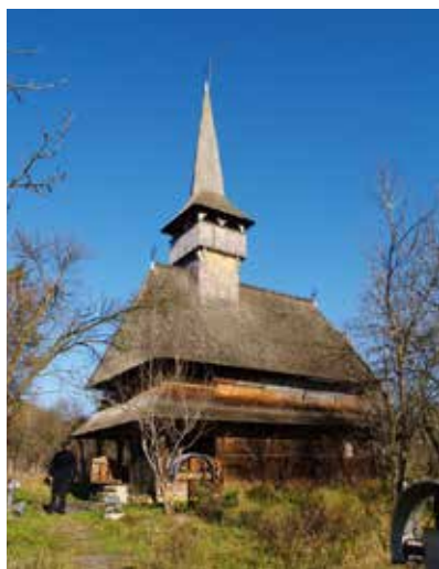
Fig. 1 Bârsana (foto 2017, arhiva INP)