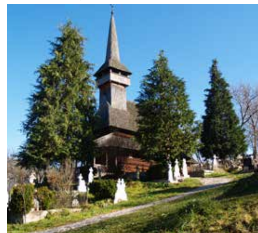
Fig. 5 Poienile Izei (foto 2017, arhiva INP)