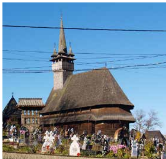
Fig. 2 Budești-Josani (foto 2017, arhiva INP)