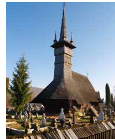
Fig. 7 Rogoz (foto 2017, arhiva INP)