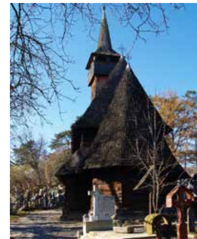
Fig. 4 Ieud (foto 2017, arhiva INP)