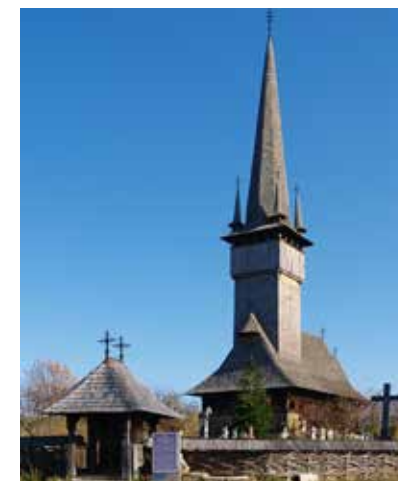
Fig. 6 Plopiș (foto 2017, arhiva INP)