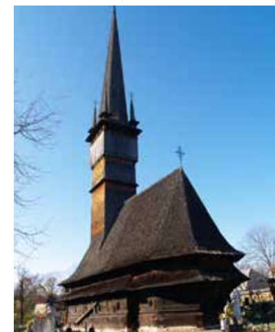
Fig. 8 Surdești (foto 2017, arhiva INP)

DIN ACTIVITATEA SISTEMULUI PUBLIC DE PROTECȚIE A PATRIMONIULUI CULTURAL