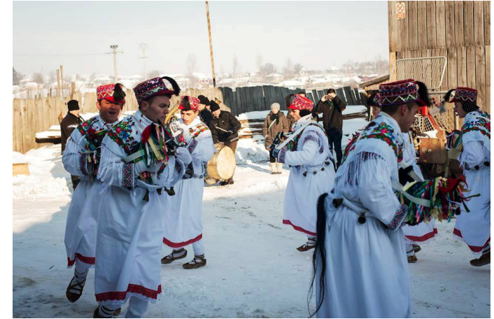
Căiuți din Cristești, județul Botoșani

Perioadă de performare: în Ajunul Anului Nou și de Anul Nou