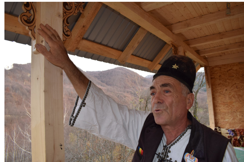
Ion Rodoș, județul Argeș, sculptură în lemn, tâmplărie, șitărie

din nuiele, instrumente muzicale, papură, pănuși, învelit construcții, jucării, măști tradiționale, olărit, opincărit, ouă încondeiate, podoabe, prelucrarea os, piatră, lemn, metale, piele și blană, țesut, vărărit etc. Apoi, sunt completate informațiile referitoare la datele de contact și cele biografice ale meșterului, la caracteristicile obiectelor lucrate (formă, dimensiune, funcție, ornamentică, tehnici de lucru, materiale folosite), la terminologia locală a instrumentelor de lucru, la tipologia obiectelor, la respectarea tiparului tradițional, dacă are continuatori, etc. Pasul trei îl reprezintă existența declarației meșterului cu privire la utilizarea datelor cu caracter personal, necesară pentru includerea fișei de meșter în Repertoriul meșterilor și practicilor tradiționale . Pasul patru implică adăugarea unei fotografii de tip portret a meșterului și cel puțin a unei fotografii de tip obiect a produselor meșteșugului. Pasul cinci indică înregistrarea cu succes a meșteșugarului în baza de date online.