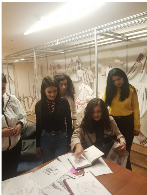
Atelier de creație - Studente la Universitatea din București (specializarea Etnologie), 2019

în sus, pornind de la sensul inițial de cămașă purtată de femei, „ale cărei poale ajung până dincolo de genunchi”.