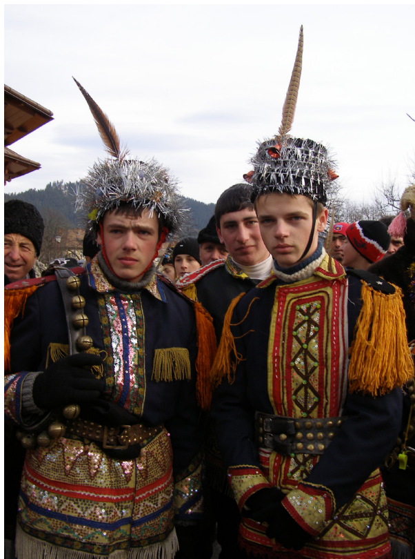
Bungheri din zilele noastre - Câmpulung Moldovenesc, județul Suceava

Practicanți: comunități, grupuri, persoane Comunitățile mai sus-menționate unde obiceiul este încă viu. Există și localități în care în ultimii ani obiceiul nu s-a mai performat. Cete mici, de patru copii, până la cete mai mari de adolescenți sau chiar maturi; feciorii mai mari. Ceata este alcătuită dintr-un număr cu soț de băieți, variind între 4 și 30, pentru a putea „face cruciș” în timpul jocului. Vârsta feciorilor este de la 8 ani până