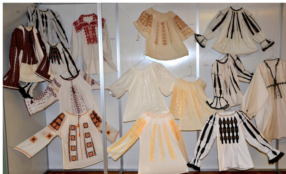
Realizare expoziție - panotare

legătură cu acest ultim aspect, trebuie amintite poziția geografică și condițiile istorice concrete, datorită cărora limba română a venit în contact cu mai multe limbi, dovedindu-se penetrabilă la înrăuriri străine, în special în domeniul vocabularului.