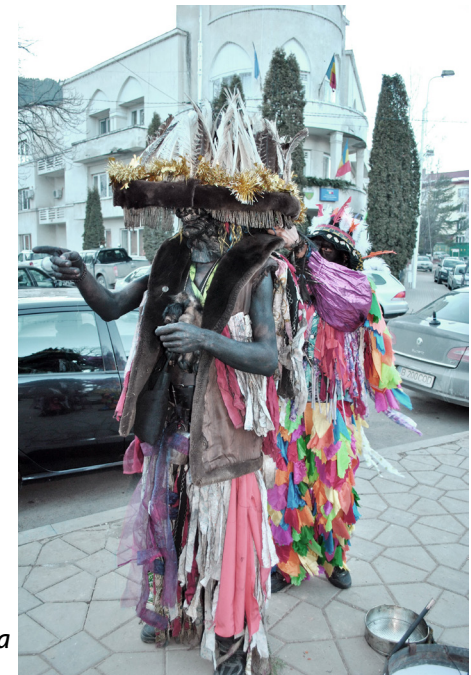
Țigan din Câmpulung Moldovenesc, jud. Suceava

Cei prezenți în Bucovina, la cumpăna dintre ani, sunt prinși mai mult de spectacol, ignorând ceea ce este, de fapt, rațiunea întrunirii cetei. Ba chiar și în ochii performerilor, actualul lor dans are ca argument păstrarea tradiției, chiar ei ignorând faptul că ceea ce îi leagă este momentul vieții premergător căsătoriei. În ansamblul comunității, ei prezintă dintotdeauna mesajul unei vârste, una dintre unitățile tradiționale de organizare a băieților necăsătoriți, cu rol inițiativ,