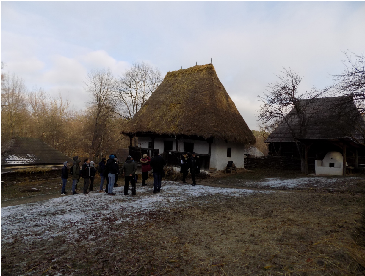
Învelirea casei cu paie călcate - gospodăria-atelier de spătari, Râșculița, județul Hunedoara din Complexul Național Muzeal „ASTRA”