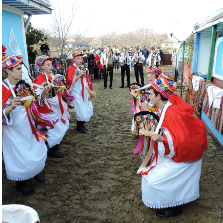
Căiuți din Durnești, județul Botoșani