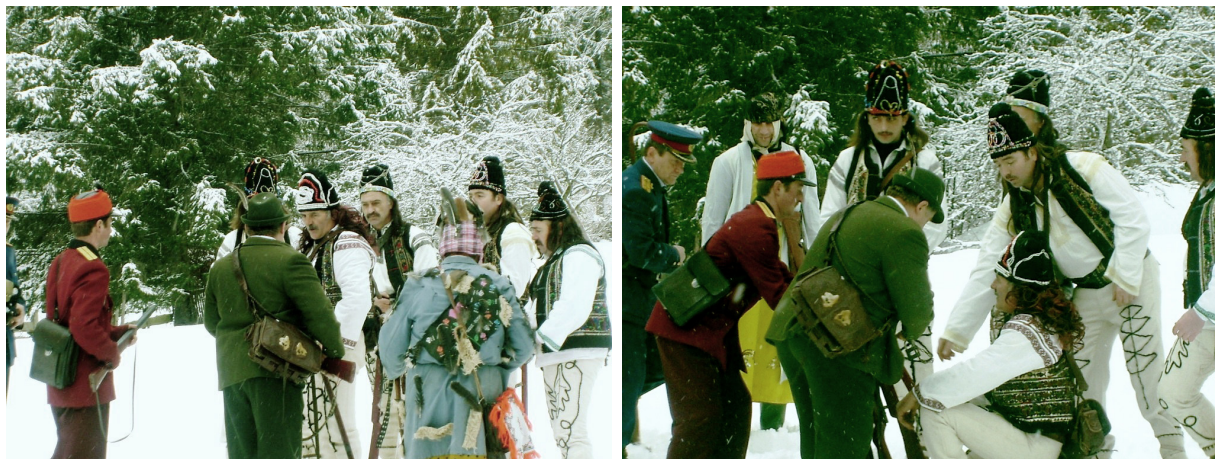
Jieni, județul Neamț

efortul membrilor cetei de a învăța și repeta o astfel de piesă.