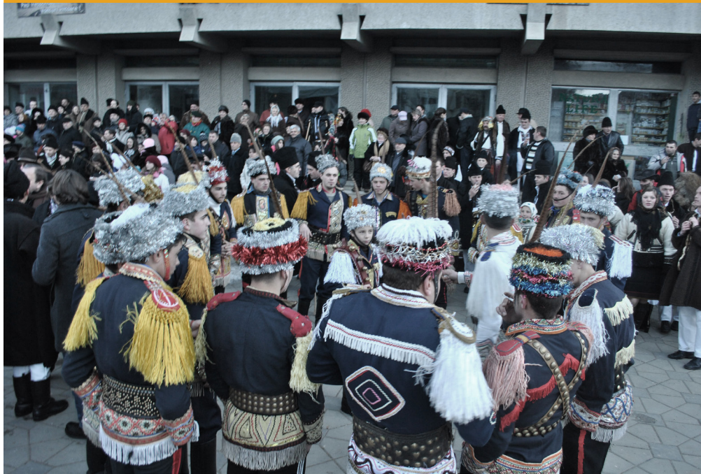
Bungheri din zilele noastre - Câmpulung Moldovenesc, județul Suceava

numărului mare al membrilor cetei, care necesită răsplată pe măsură.