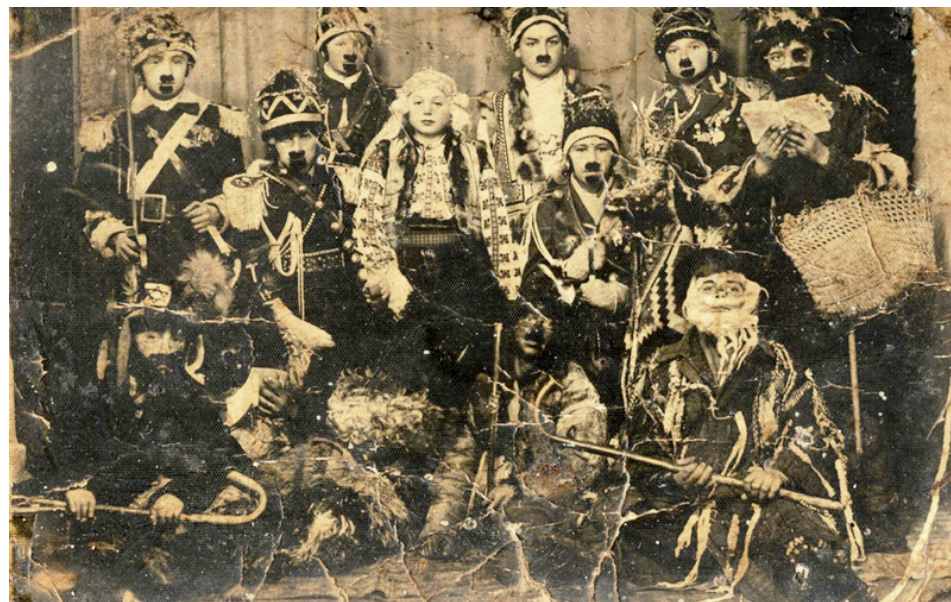
Bumbierii - 1942