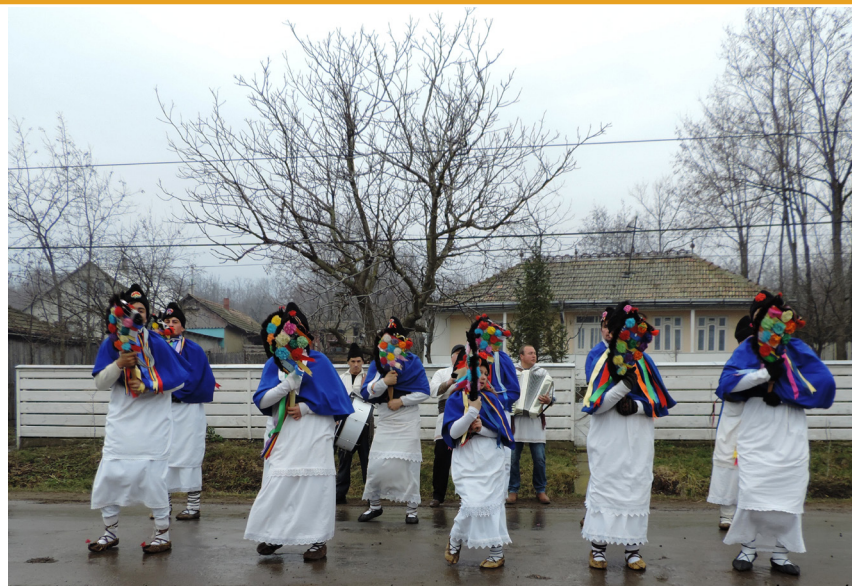
Căiuți din Albești, județul Botoșani