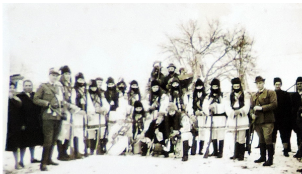
Jieni, județul Bacău

În mod evident, o astfel de piesă complexă și de mari dimensiuni pare a fi anacronică în cultura populară a secolului nostru, când puțini dintre indivizii înzestrați din comunitățile rurale își fac timp și pentru a face parte dintr-o astfel de trupă de teatru popular. Totuși, pentru a susține existența vie și transmiterea în timp a piesei, comunitățile studiate au găsit drept variantă perpetuarea acestui fel de piese cu ajutorul școlii sau într-o îngemănare dintre școală, căminul cultural și cu contribuția materială a primăriei, care asigură finanțarea costumelor și a recuzitei. Mai rar, se găsesc cete de oameni maturi, care, pe cont propriu, sau cu ajutorul instituțiilor mai sus-menționate, mai doresc să perpetueze benzile haiducești. Se preferă însă alegerea variantelor prescurtate, uneori trunchiate, eludând pasaje de text, dacă nu chiar momente ale scenariului pieselor. În ceea ce privește costumele și recuzita, ni se pare că se fac mai puține compromisuri, cel puțin latura materialistă a vremurilor actuale putând să susțină și o astfel de piesă, acolo unde aceasta se mai performează.