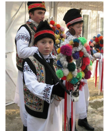
Căiuți din Vorona, județul Botoșani