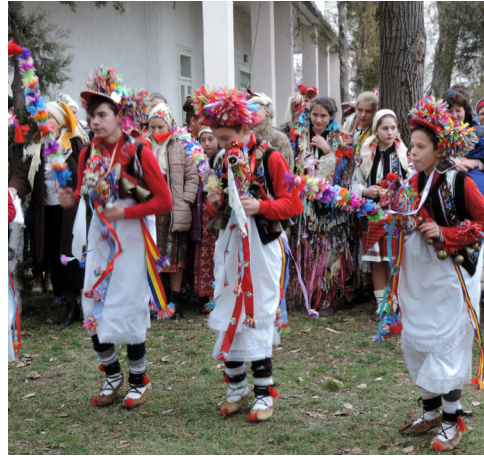
Căiuți din Albești, județul Botoșani